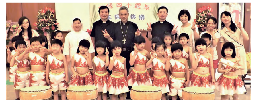
▲欣逢主保日，小朋友齊來鳴鼓慶賀。