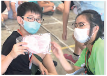
▲旗山國小小朋友展示共同傳遞愛X關懷的幸福卡片。