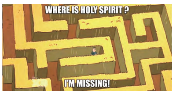
▲「阿Ben的靈修梗圖系列」：參加讀書會的青年用圖像記錄讀書會的所得。