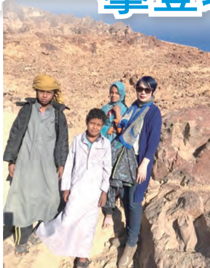
▲可愛的貝都因小孩。 ▶站在西奈山高舉雙手，讚美我的天主！

忽然，看見在我前面的人摔下來，「因為駱駝鬧脾氣不開心！」傻眼！這項沒有在導遊警告中的意外，而我心有餘而力不足，沒有辦法「下車查看」，只能隨著駱駝超車「輕喊」（不可以大聲，不然嚇到駱駝，牠會狂飆）「有人