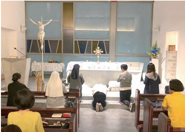
▲帶領學員明供聖體，與天主在守聖時祈禱中相遇。