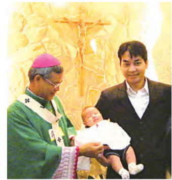
▲為嬰兒領洗，流露出無限慈愛。