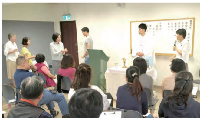
▲課程中，講解感恩祭典中，每一禮儀細節的涵義。