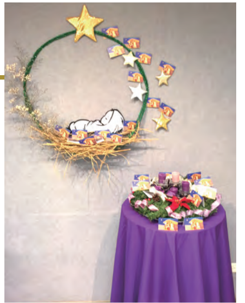
▲符合教會禮儀節慶的布置，提升課堂氛圍。