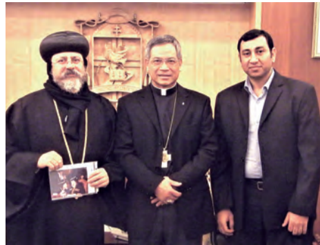
▲埃及總主教來訪，促進普世教會交流。