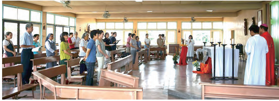
▲2019年於嘉義教區斗六舉行的聖神降臨節避靜

備晚餐、一起整理環境，過程中，夥伴們彼此聊天、有說有笑的，就如同避靜課程所告訴我們的一樣：「聖神在我們當中，且使我們心中燃起愛火。」