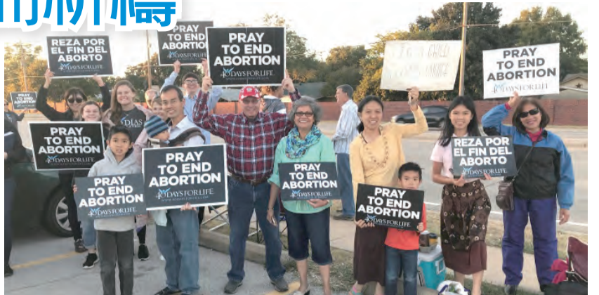
▲在美國計畫生育聯合會前祈禱的人群，手持標語牌，努力挽救胎兒生命。

「40天為生命」的接力祈禱，多選在教會四旬期的春季和秋季舉行。據羅馬教廷官方報載，全世界有超過1百萬人曾參加了這項運