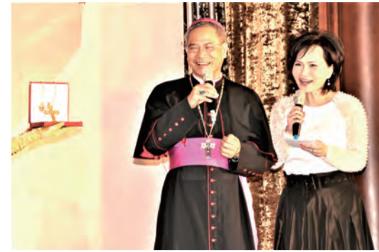
▲為單樞機弱勢基金會成立，慷慨捐出教宗所贈十字架義賣。