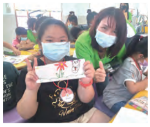
▲文藻師生與旗山國小小朋友共同手繪愛心口罩套。