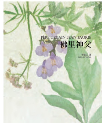
▲林業試驗所與中華民國自然與生態攝影學會策畫出版的《佛里神父》一書，是至今全球唯一將佛里神父的貢獻完整展現之作。