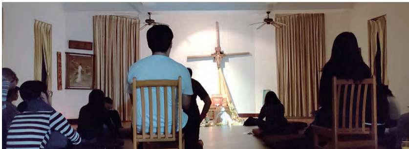
▲2019年於新北市泰山區洗心靈修中心舉辦的耶穌君王節避靜，與瑪利亞方濟各修會的修女一起響應國際聖體大會的全球明供聖體邀約。