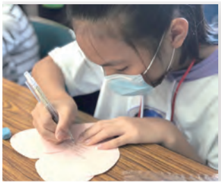
▲高雄旗山國小小朋友手繪健康與寫滿祝福的愛心卡片。