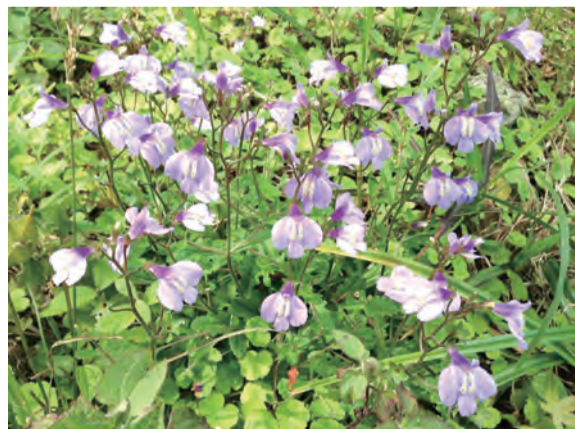
▲佛氏通泉草是以佛里神父命名的植物，春天花開遍及台灣山野，不忘他為台灣植物分類打下的基礎。

活動報名： btf3588cly@gmail.com 姜樂義老師 活動免費，午餐自備，專題講座自由奉獻。 連絡電話：0910-501-486