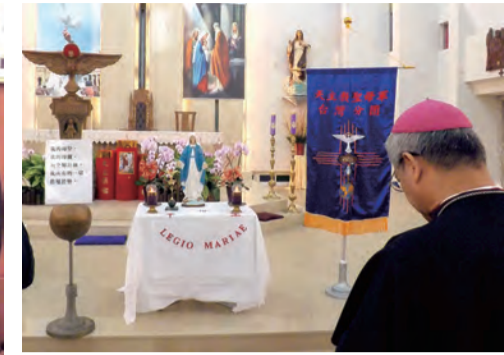
▲一生效忠聖母軍，孝愛依恃在主前。樹林耶穌聖心堂落成，同心祝福新堂更上層樓。