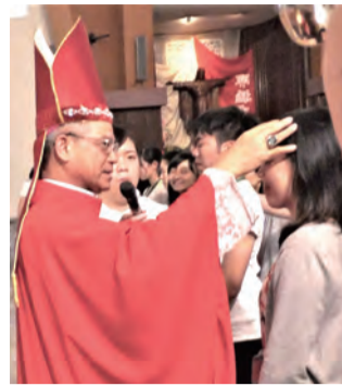
▲關懷青年牧靈，讓青年發揮專才。