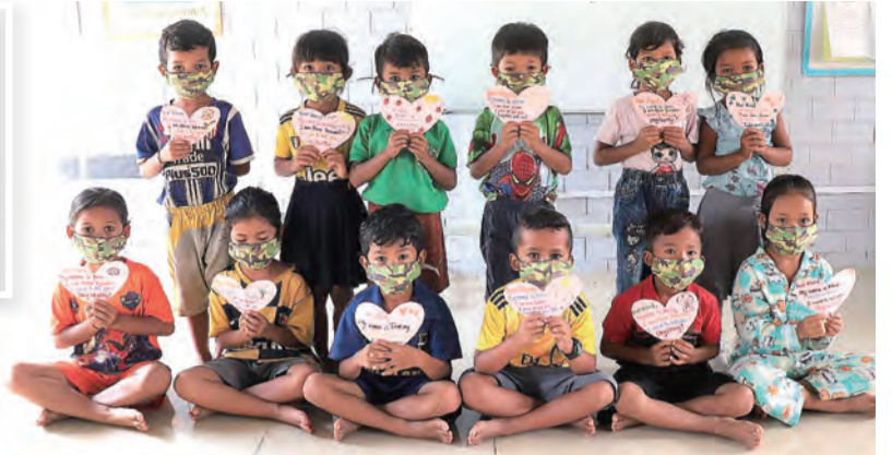
▲東國的小學生們小手緊握愛心卡片，撥種愛心與祝福。