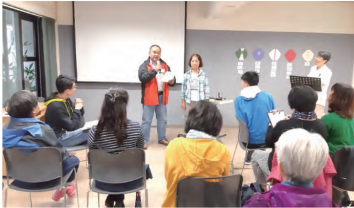
▲課程中的小組分享，鼓勵學員們傳遞心得的思緒彙整及表達技巧。