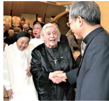
▲對年長修女關懷備至，十分暖心。