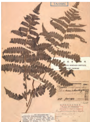
▲黑葉貞蕨標本，右邊第二個標籤即為佛里神父手寫字跡。