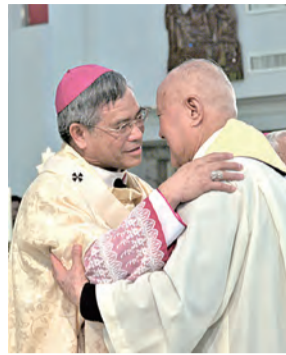
▲輕輕擁抱，說聲感恩，同鐸深情，溢於言表。