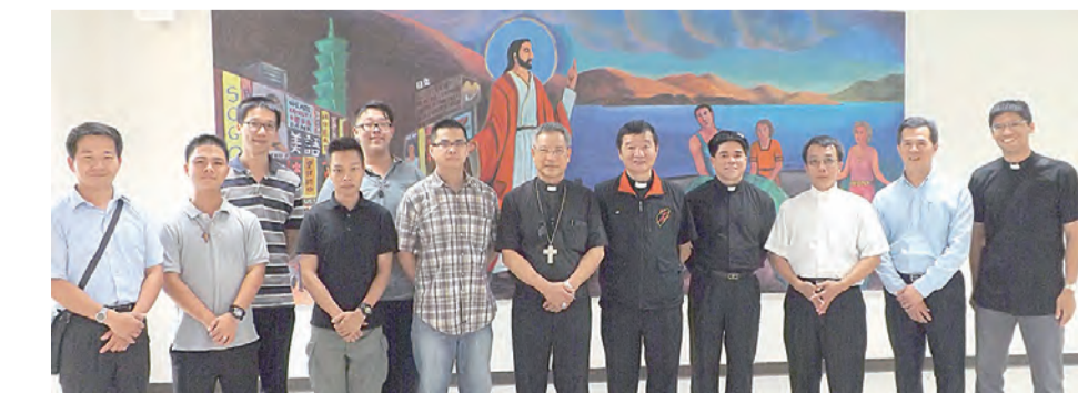
▲洪總主教注重聖召，親自送修生到台北總修院報到。

展品中最貴重的「埃德薩的耶穌聖容聖像」（Mandylion of Edessa）在展期圓滿結束後，於